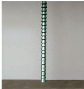
"Chaînes" Metal Green Single 8 pieces + 2 A.P. + 2 Prototypes