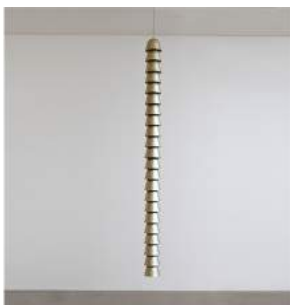
"Chaînes" Metal Champagne Single 8 pieces + 2 A.P. + 2 Prototypes