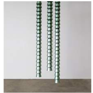
"Chaînes" Metal Green Triple 8 pieces + 2 A.P. + 2 Prototypes