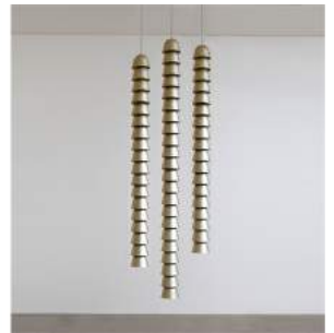
"Chaînes" Metal Champagne Triple 8 pieces + 2 A.P. + 2 Prototypes