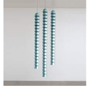
"Chaînes" Metal Blue Triple 8 pieces + 2 A.P. + 2 Prototypes

Exhibition: from 4th November 2016 until 7th January 2017