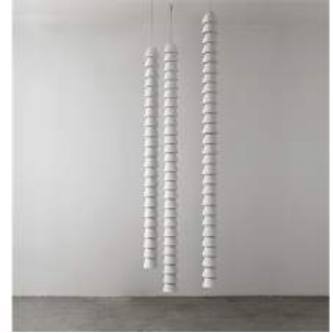
"Chaînes" Mineral Triple 8 pieces + 2 A.P. + 2 Prototypes

Exhibition: from 4th November 2016 until 7th January 2017