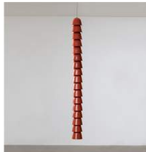
"Chaînes" Ceramic Single 8 pieces + 2 A.P. + 2 Prototypes