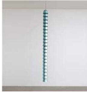
"Chaînes" Metal Blue Single 8 pieces + 2 A.P. + 2 Prototypes