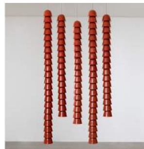
"Chaînes" Ceramic - 3 to 5 8 pieces + 2 A.P. + 2 Prototypes