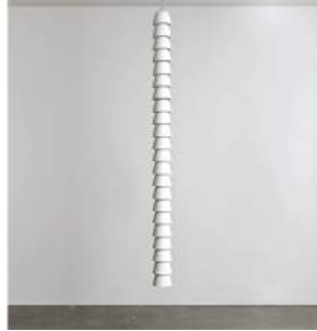
"Chaînes" Mineral Single 8 pieces + 2 A.P. + 2 Prototypes