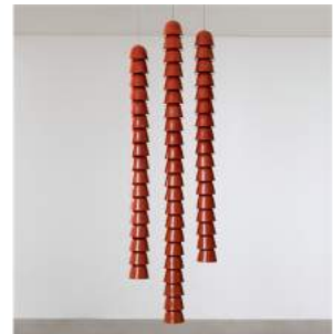
"Chaînes" Ceramic - 3 to 5 8 pieces + 2 A.P. + 2 Prototypes